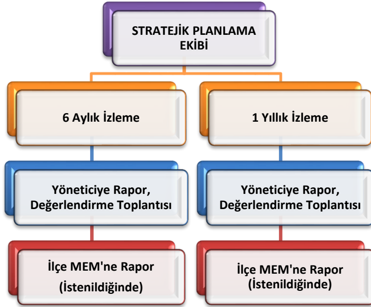
Şekil 2 Stratejik Plan İzleme ve Değerlendirme Modeli